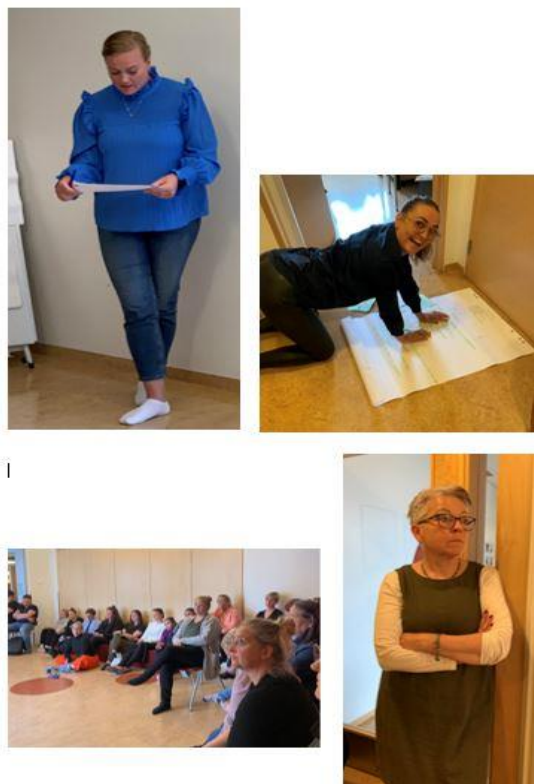
Mynd 1: Frá samráðsfundi í leikskólanum í Stykkishólmi

Brýnt er að finna leiðir til að laða fleiri fagmenntaða leikskólakennara að leikskólanum. Meðal þeirra hugmynda sem ræddar hafa verið er aukin samræming vinnutíma og leyfa á stigunum tveimur, sem og að bæta aðstöðu. Eins þarf að skapa starfsfólk leikskólans aukið svigrúm til faglegrar samvinnu, til dæmis með fjölgun starfsdaga. Áriðandi er að skólafestnan sé virk og að henni sé fylgt eftir.