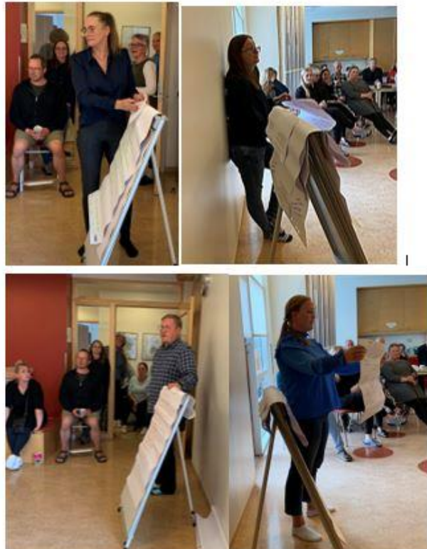
Mynd 4: Kynning á niðurstöðum umræðuhópa