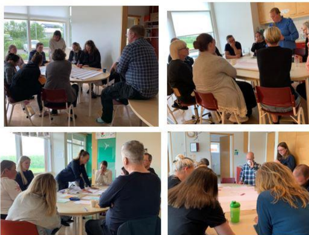
Mynd 3: Umræður á samráðsfundi